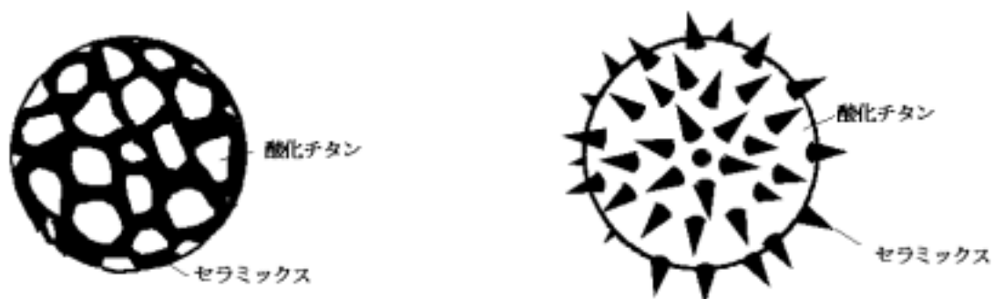
図1 繊維やプラスチックへの適用可能な光触媒

酸化チタン光触媒はほぼ全ての有機物を分解でき、抗菌防かび、水処理、大気浄化、脱臭、セルフクリーニングなど、環境分野でのさまざまな応用が可能である。しかし、酸化チタン光触媒を繊維やプラスチックに練り込むと繊維やプラスチックが光触媒作用で分解されてしまうため、繊維やプラスチックへの適用が不可能であった。そこで、光触媒繊維や光触媒をつけたプラスチックの製造を可能とするため、酸化チタン光触媒の表面を光触媒として不活性なセラミックスで被覆した被覆酸化チタン光触媒が開発された。これには、図1に示すように、マスクメロン型(図中左)や金平糖型(図中右)などの種類がある。まず、マスクメロン型の粒子は酸化チタンの表面に光触媒活性を持たないシリカ( \text{SiO}_2 、二酸化ケイ素)などのセラミックスをマスクメロンのマスクのように被覆したもので、繊維やプラスチックに練り込んでも、表面にある光触媒作用を持たないシリカによって酸化チタンが繊維やプラスチックと接触しにくくなり、分解しにくくなる(図1中の左)。また、金平糖型の粒子は酸化チタンの表面に光触媒活性を持たないアパタイトなどのセラミックスを金平糖の角のようにして被覆したものであり、同様に繊維やプラスチックに練り込んでも、表面にある光触媒作用を持たないアパタイトが酸化チタンによる繊維やプラスチックの分解を防ぐ(図1中の右)。さらに、シリカゲルなどの多孔質粒子の細孔内に酸化チタン光触媒粒子を充填した被覆酸化チタン光触媒もある。これは酸化チタン光触媒が多孔質粒子の表面には付いていないため、同様に、繊維やプラスチックに練り込んでも繊維やプラスチックの分解が起こりにくくなっている。これらの被覆酸化チタン光触媒が開発されたことによって、繊維や紙、プラスチックなどへの実用化が進み、製品化されるようになってきた。さらに、これらの被覆酸化チタン光触媒は多孔質で表面積が大きいいため、悪臭などの対象物質を光触媒表面に吸着して濃縮でき、効率良く分解処理することができる。そして、光がないときでも悪臭などの対象物質を吸着することができ、その後、当たってきた光を利用して分解することができる。